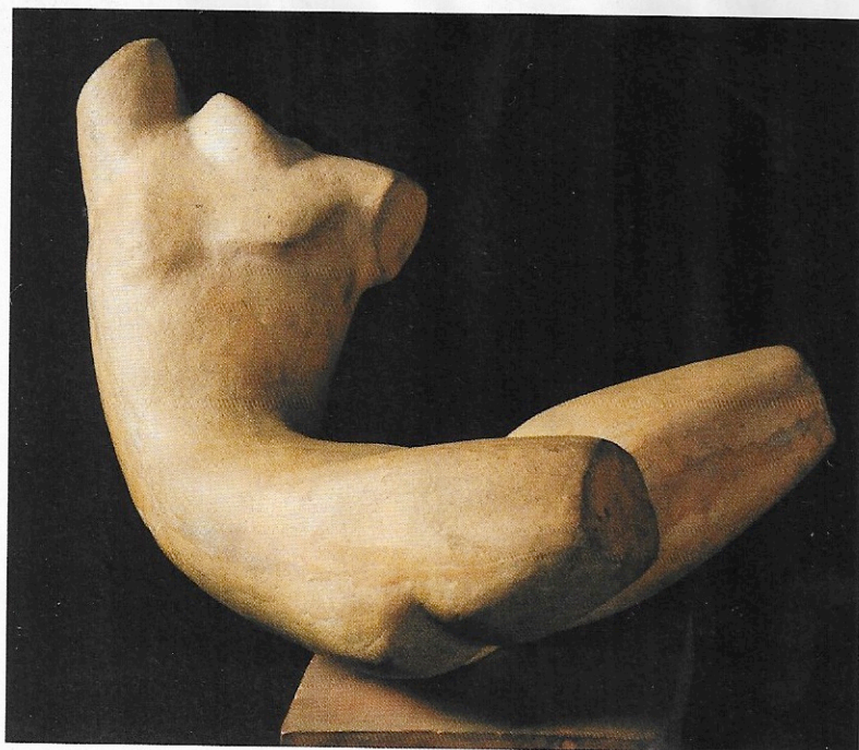
Alexander Archipenko Torse féminin , vers 1910